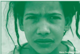
Mario Pascucci © 2007